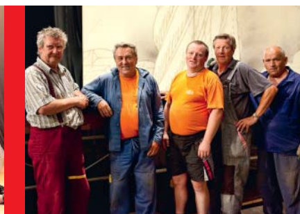
Stavební četa má každoročně na starosti přípravu jeviště a hlediště.

Co vám na letošním ročníku udělalo radost?