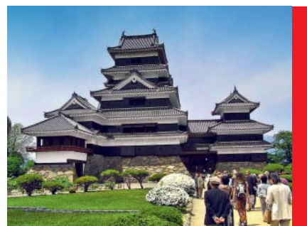
Hrad Matsumoto Jyo